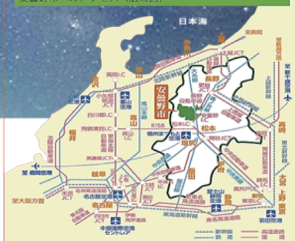
安曇野市へのアクセス (広域図)